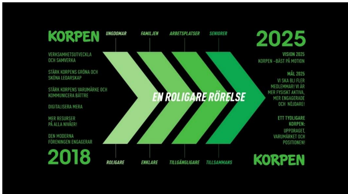
Korpens strategi 2018-2025

Föreningens 181 (186) ideella ledare har tillsammans med de 14 (14) anställda arbetat efter verksamhetsplanen för 2019-2021, vår verksamhetsidé – ”Korpen gör det enkelt för människor att sporta och ha kul tillsammans” och vår värdegrund – glädje, gemenskap och alla är välkomna!