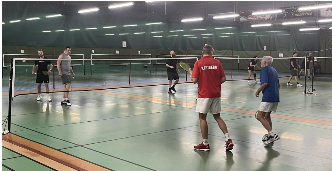
Match om 1:a pris