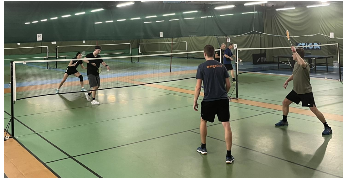
Match om 5:e plats