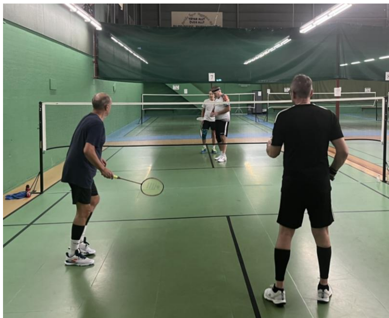
Match om 3:e pris