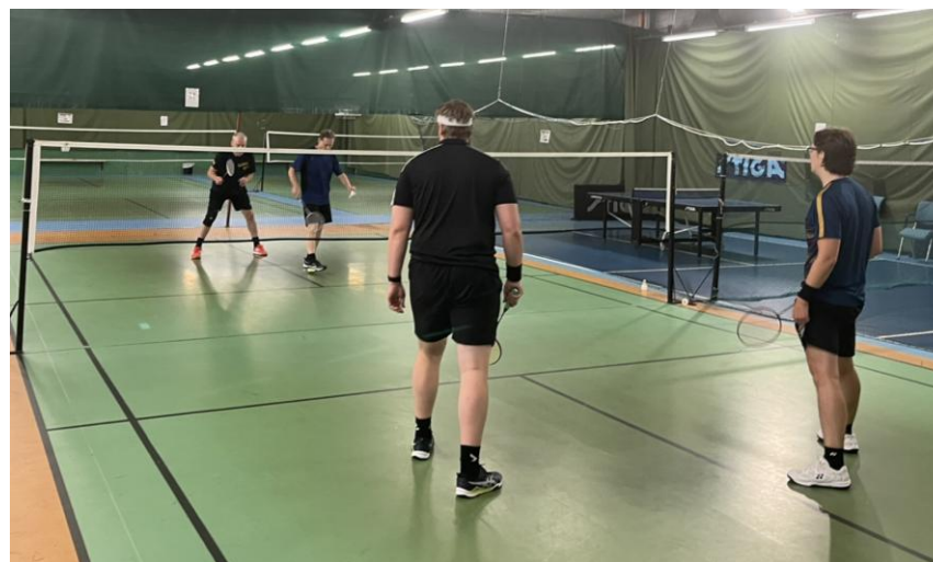
Match om 7:e plats