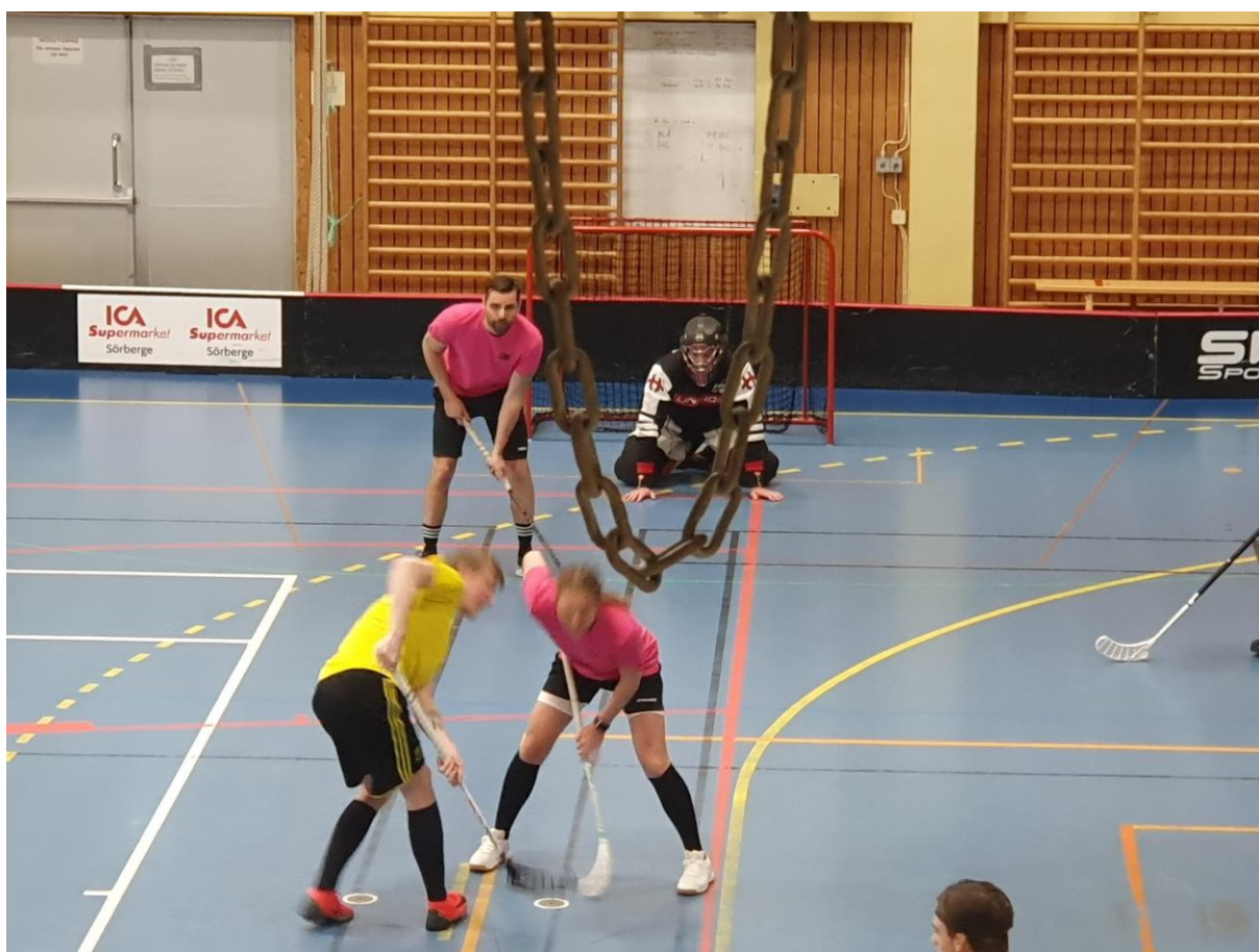
En av innebandymatcherna i "Grundström Cup" i Timrå Sporthall 15 april 2023